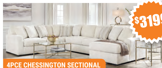
4PCE CHESSINGTON SECTIONAL

10 Matthews Ave, Pembroke Ontario K8A 8A4 613.629.5464 • 613.629.5465 www.AshleyPembroke.ca OPEN SUNDAYS 11AM - 4PM