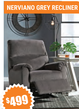
NERVIANO GREY RECLINER