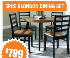
5PCE BLONDON DINING SET